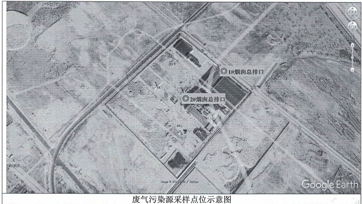
废气污染源采样点位示意图