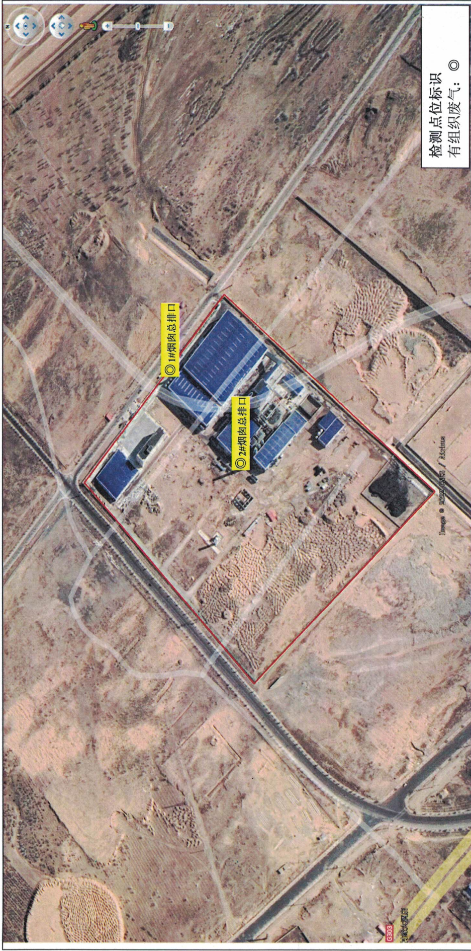
废气污染源采样点位示意图