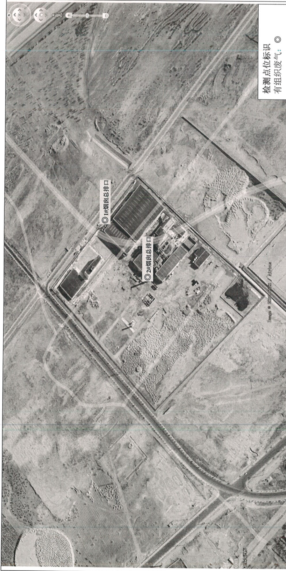
废气污染源采样点位示意图