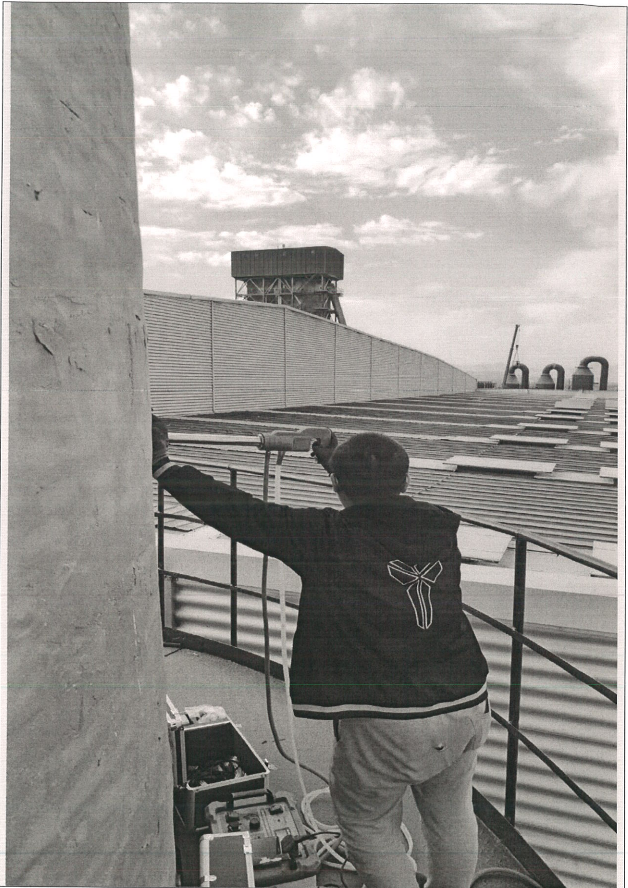
废气污染源采样实景图