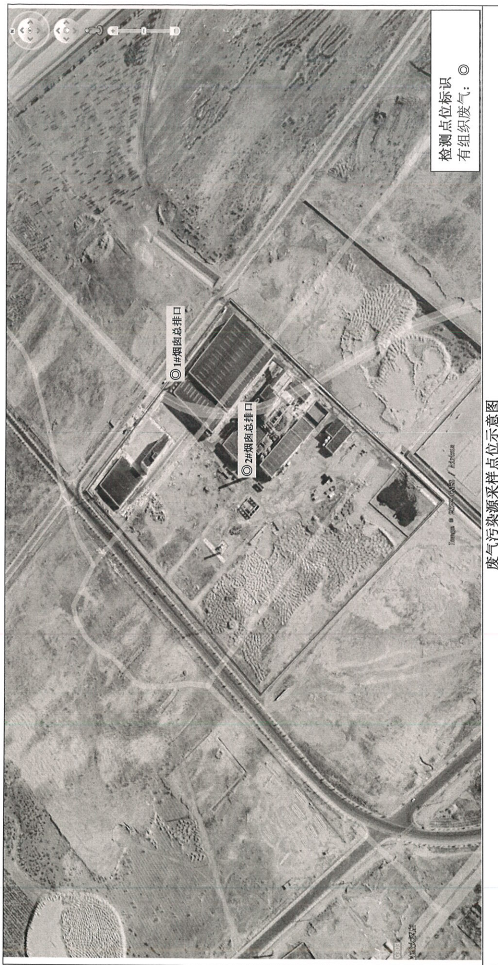
废气污染源采样点位示意图